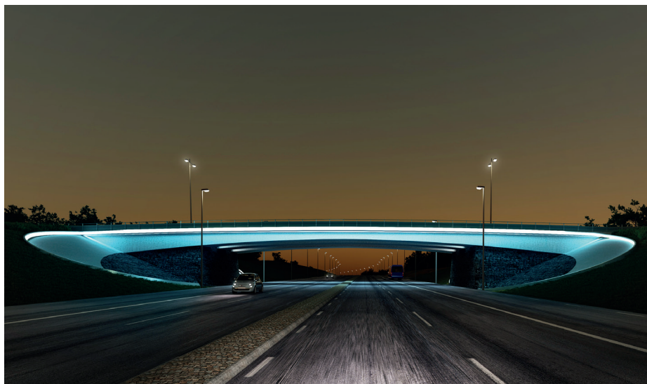
Den nya bron kommer stå klar 2017. Illustration: Arkitekterna Krook & Tjäder.