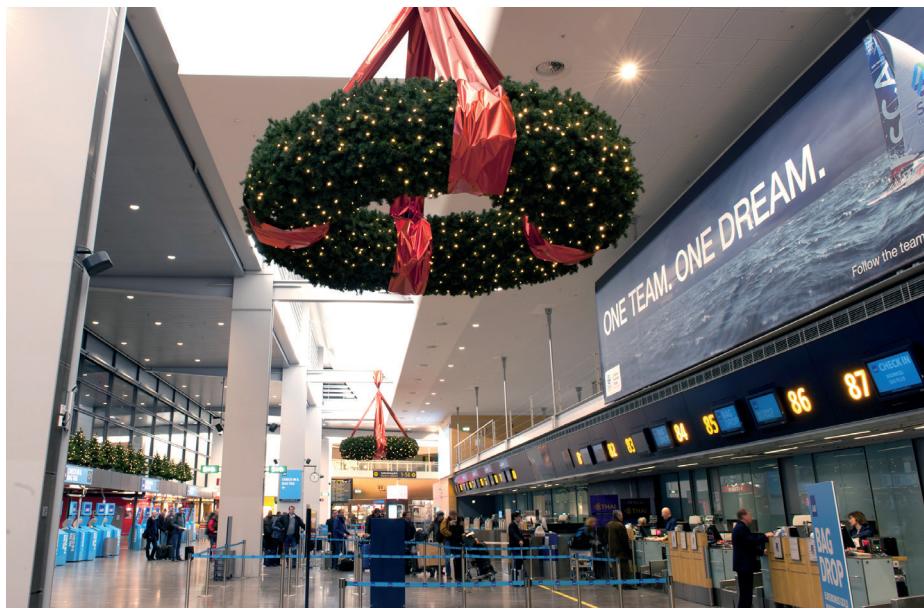
Kom förbi och prova något av flygplatsens alla julbord.